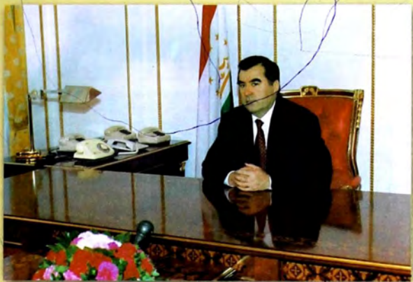
ПРЕЗИДЕНТИ ҶУМҲУРИИ ТОҶИКИСТОН ЭМОМАЛӢ РАҲМОНОВ